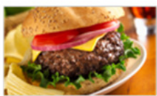
Burger meal with chips containing 80 g of fat