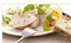
Chicken breast as part of a meal containing 15 g of fat

Por outro lado, se tomar alli com uma refeição com alto teor de gordura, como um hambúrguer e batatas fritas contendo aproximadamente 80 g de gordura, serão excretados cerca de 20 g e pode sofrer efeitos do tratamento relacionados com a dieta. Estes efeitos, como uma necessidade urgente de ir à casa de banho, estão muito relacionados com os níveis de gordura ingeridos. Tem menos probabilidades de ter problemas se seguir a dieta recomendada baixa em gorduras.